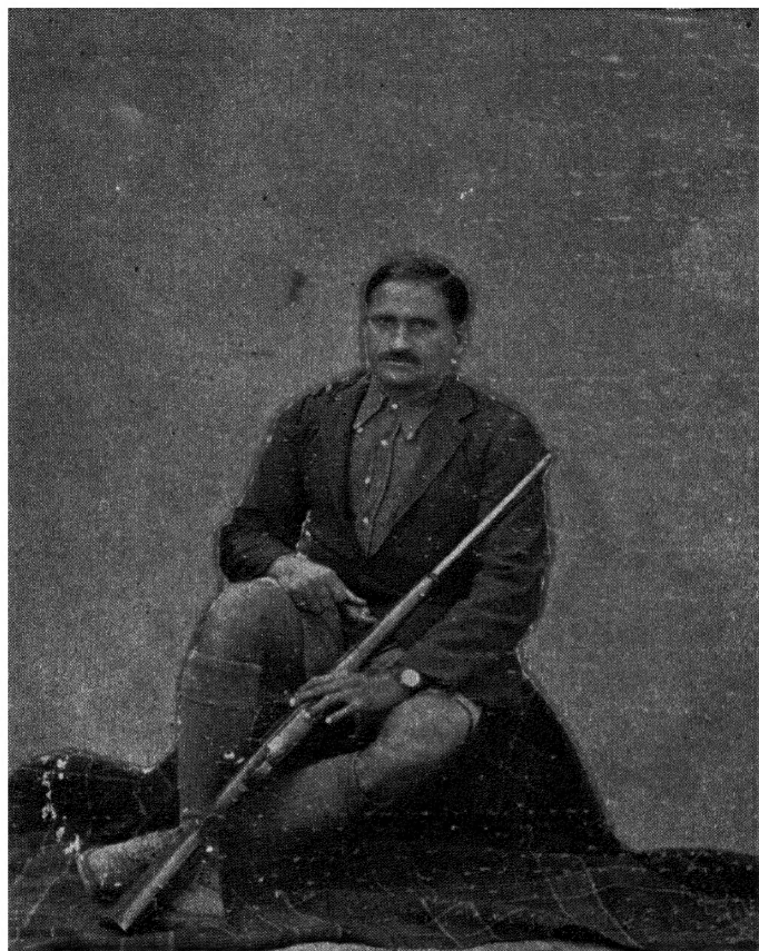
लेखक सन् १९२६ में